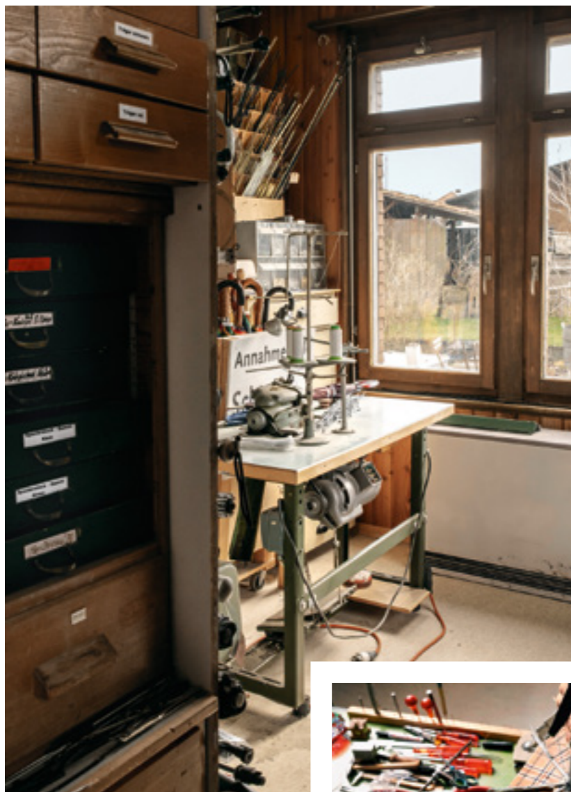
Auch eine Nähmaschine gehört zur Ausstattung des Ateliers.